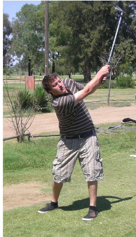
Beim Golfen mit den Kids aus Thusong. Das macht Lust auf mehr!

anzutreffen, wie es eigentlich hätte sein sollen, sondern befanden sich auf den Straßen Kimberleys. Dort verdienten sie sich meistens durch Autos einweisen ein wenig was dazu und besuchten alte Freunde. Immer waren der oder diejenige mal eben wieder kurz in der Stadt. Die Verlockung der Straße ist für viele immer noch sehr groß, die meisten von ihnen kommen aber immer zum Abendessen wieder zurück. Nur für uns hieß das manchmal, dass wir manch eine geplante Aktion voll in den Sand setzen mussten und uns eine Alternative überlegen mussten oder einfach diese mit den sehr viel jüngeren Kindern zu machen, was auch nicht höchst dramatisch war, allerdings wollte man doch auch alle Facetten des Lebens in Thusong erfahren.