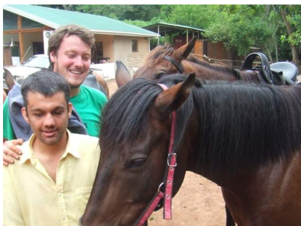
Zorro und ich beim Putzen der Pferde

Gärtnerei gehört genauso dazu wie das tägliche Bürsten und Füttern der sechs Pferde. Jeder Bewohner der Farm hat seine Aufgaben, für die er verantwortlich ist. Hierbei geht es dann manchmal um das Reinigen des Pferdepeddocks oder einfach nur um das Fegen der Veranda. Es sind aber nicht nur Menschen mit einer geistigen Behinderung die auf dieser Farm leben, sondern auch trockene Alkoholiker, ehemalige Drogenabhängige oder Jugendliche die auf die schiefe Bahn gekommen sind. Es ist ein ganz breit gefächertes Spektrum an Menschen die an diesem Ort zusammen gekommen sind und die diesen sehr interessant machen.