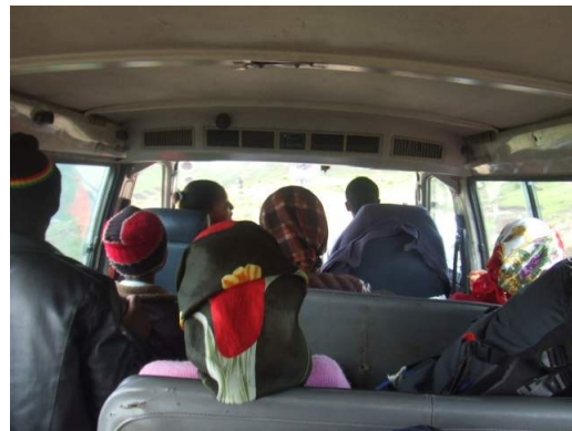
Die Aussicht in einem Mini-Bus Taxi von der hintersten Reihe. Ein wahrer Todesritt!