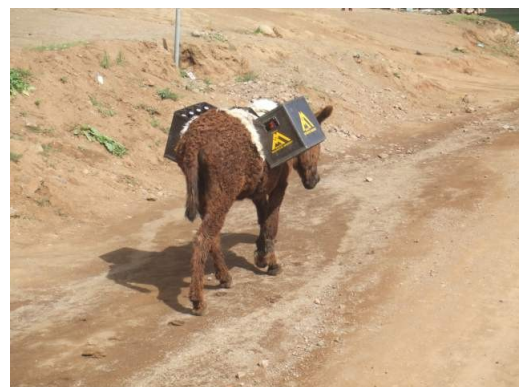
Er war uns ein langer Weggefährte. Ein Esel mit zwei Kästen Bier auf dem Rücken...