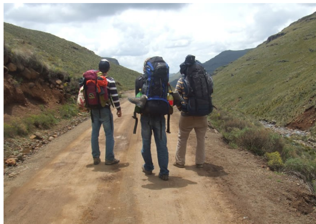
"Ausgesetzt in Lesotho"

allerdings mindestens fünf Stunden Fußweg entfernt sein, wie wir später erfuhren. Augenscheinlich liefen wir völlig alleine auf dieser Straße, um uns herum diese wunderschöne Kulisse. Wir machten eine Pause und stärkten uns mit selbstgebackenem Brot und Thunfisch aus der Dose.