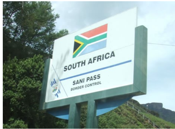
Südafrikas Grenze zu Lesotho

Wir nahmen unsere Rucksäcke von der Ladefläche und verabschiedeten uns. Wir standen auf einer Schotterpiste. Links und Rechts neben uns riesige Berge, vor uns ein Tal durch das sich die Schotterpiste schlängelte. Weit und breit keine Menschenseele zu sehen. Also machten wir uns auf, nun allerdings zu Fuß, um am selben Tag noch die nächst größere Stadt namens Mokhotlong zu erreichen. Diese sollte