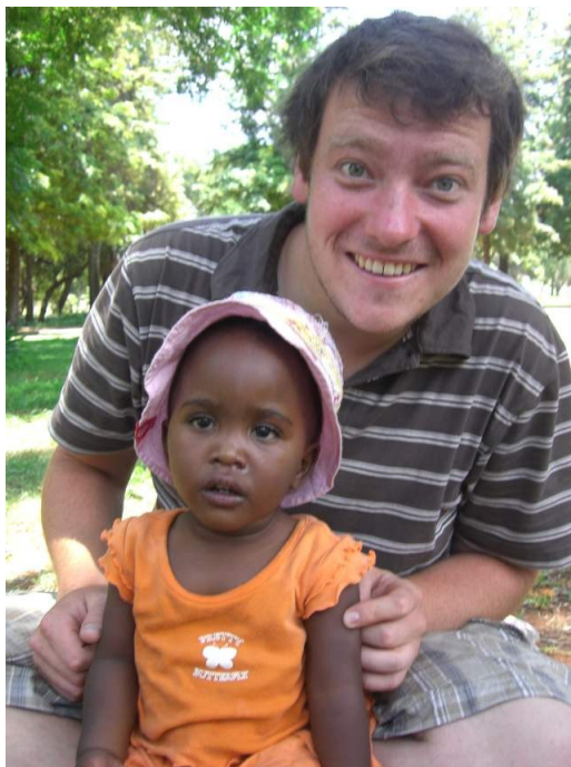
In Thusong ist ein „neues Baby“ abgegeben worden...keiner kennt ihren Namen...

„Thusong“ leben zur Zeit ungefähr 90 Kinder in drei Wohnhäusern, die aus verschiedensten Gründen nicht mehr bei ihren Familien leben. Einige von