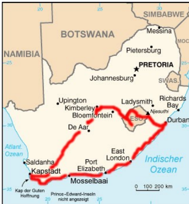
Noch einmal die Route: von Durban nach Harding, durch Lesotho, nach Kimberley, von Kimberley nach Capetown und wieder zurück nach Durban!