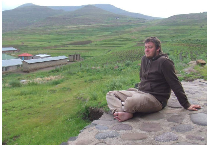
Angekommen in Mokhotlong