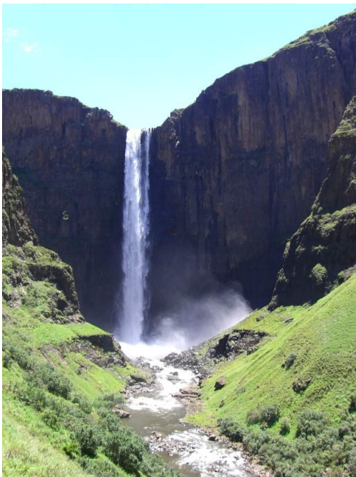
Der höchste Wasserfall im südlichen Afrika, mit einer Höhe von 204 Metern sehr eindrucksvoll...