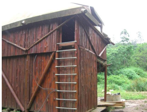
Unsere Unterkunft für eine Woche, ein sehr gemütliches Haus auf Stelzen

Die letzte Etappe ist erreicht. Nach 26 ½ Stunden Busfahrt von Kapstadt nach Durban sind wir drei Reisenden in Shongweni gelandet. Shongweni ist ein eher ländlicheres Gebiet, nicht weit von der Ethembeni School und meinem Zuhause. Es waren aber ja immerhin noch Ferien. Also haben wir für eine weitere gute Woche die Horizon Farm in dem besagten Shongweni aufgesucht. Auf dieser Farm leben geistig behinderte Menschen und es wird versucht sie, soweit wie möglich, in das Farmleben zu etablieren. Die 600 Quadratmeter große