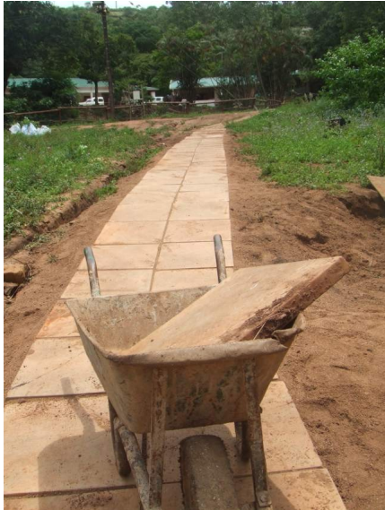
"Unser" Weg....wir haben unsere Fußabdrücke hinterlassen...

bekam von uns eine neue Wandfarbe, ein über hundert Meter langer Weg wurde mit Platten ausgelegt und viele, weitere kleine Arbeiten wurden von uns vollzogen. Immer haben wir aber versucht, ein paar Farmbewohner mit einzubeziehen, denn einige von ihnen haben nach der täglichen Pferdeeinheit kaum noch was zu tun. So kam es dann, dass uns bei den Arbeiten immer jemand zur Hand ging. Wir hatten eine wunderschöne Zeit auf der Horizon Farm und werden mit Sicherheit dorthin für die nächsten Ferien zurückkehren.