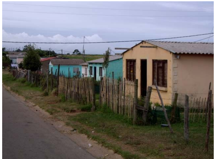
Ein Gang durch das Township...