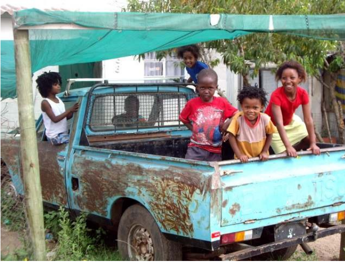
Kinder aus Kwanokuthula

Zwischentreffens gingen wir darauf ein, wie unser Freiwilligendienst bisher verlaufen ist, wie der Einstieg für uns war, was für Probleme in dem letzten halben Jahr aufkamen und wie wir damit umgegangen sind. Desöfters konnte man Parallelen erkennen und es auf seine eigenen gemachten Erfahrungen beziehen, was sehr hilfreich war. Oft wurden Probleme offen in der Runde angesprochen und