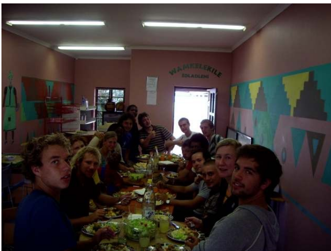
Erfahrungsaustausch beim Mittagessen im Community Centre

einem Shelter für Straßenkinder). Alle drei Leben und Arbeiten in dem Township „Kwanokuthula“, welches nur fünf Minuten Taxifahrt von Plettenberg Bay Stadtmitte sich befindet. Hier trafen Welten aufeinander. Der luxuriöse Touristenort mit seinen Tausenden Geschäften und auf der anderen Seite Armut, das ganze ca 2 Km von einander entfernt.