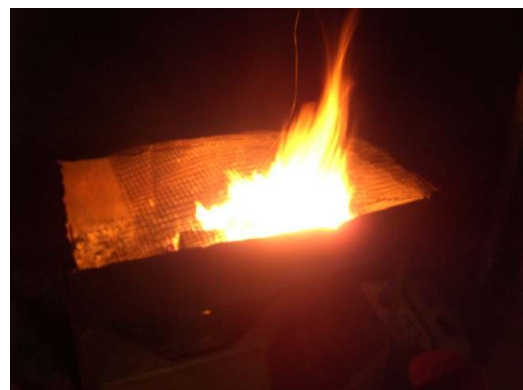
...bei Stromausfall wird auch öfter mal der Grill angeschmissen...

versucht dieser Stromknappheit nun also seit Januar mit dem Abschalten von Stadt "Blocks" für jeweils zwei Stunden pro Tag (zur Anfangszeit auch mehrmals pro Tag) Einhalt zu gebieten. So hat beispielsweise Montags Hillcrest von 14-16 Uhr keinen Strom, und Monteseel und Inchanga von 20-22 Uhr. Gemeinde und Städte wurden in "Blocks" aufgeteilt, denen in einem angeblich fairen System, regelmäßig der Strom abgeschaltet wird. Dieses "Stromsparen" bezieht sich auf das gesamte Land. Die Folgen sind fatal. Die kleinste Region Südafrikas namens Gauteng (rund um Johannesburg und Pretoria gelegen) macht den Großteil der wirtschaftlichen Kraft des Landes aus. In dieser Region liegen die Gold und Silber Minen des Landes. Von Januar bis März dieses Jahres sind die Ertragsleistungen der Minen um satte 30% im Vergleich zum Vorjahr zurück gegangen. Ein anschauliches Beispiel. Natürlich sind aber auch die Kleinen betroffen, wie der Metzger von nebenan. Hat dieser kein Notstromaggregat muss er seine Ware