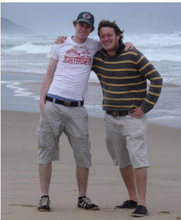
... unser Wochenendausflug nach St. Lucia ...